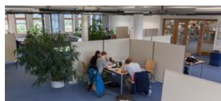
Lern- & Schulungsangebot