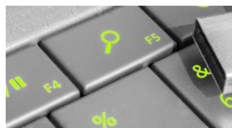
Suchen & Finden