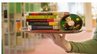
Service & Benutzung